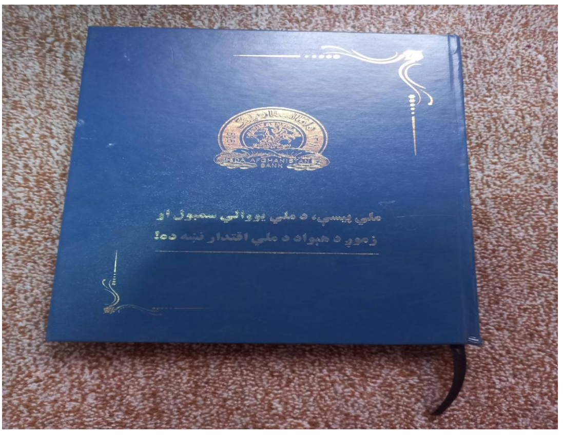
Page 4 of 4